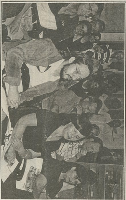
Reunião em Vaqueiros do Orçamento Participativo